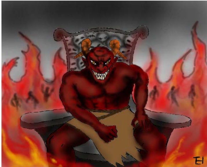
There is a cost for sin!